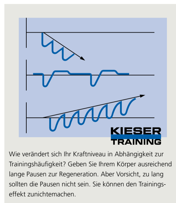
Wie verändert sich Ihr Kraftniveau in Abhängigkeit zur Trainingshäufigkeit? Geben Sie Ihrem Körper ausreichend lange Pausen zur Regeneration. Aber Vorsicht, zu lang sollten die Pausen nicht sein. Sie können den Trainingseffekt zunichtemachen.

Tage. Denken Sie immer daran, dass Sie nicht während des Trainings, sondern in der Erholungsphase stärker werden.